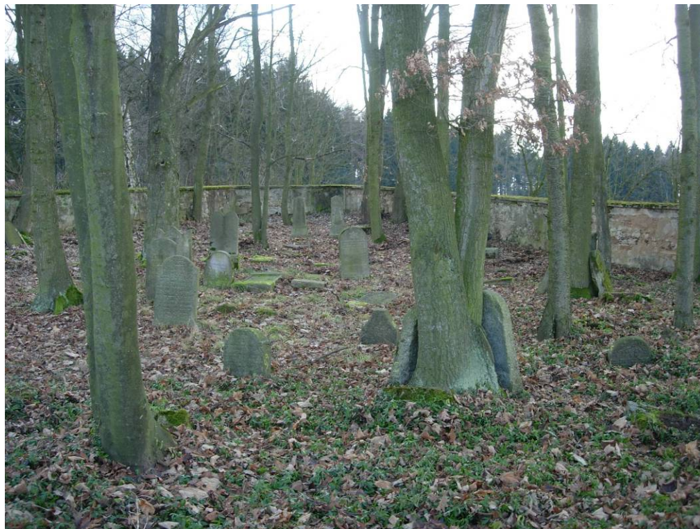
Hřbitov v Malé Šitboři v prosinci 2005