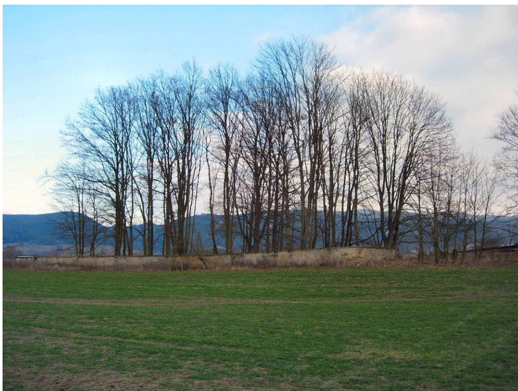
Pohled na hřbitov o jihu – prosinec 2005.