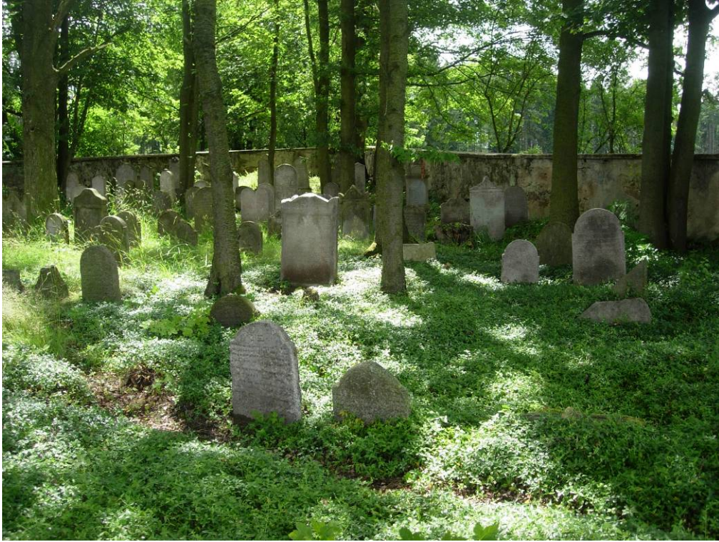
Hřbitov v Malé Šitboři v červnu 2007.