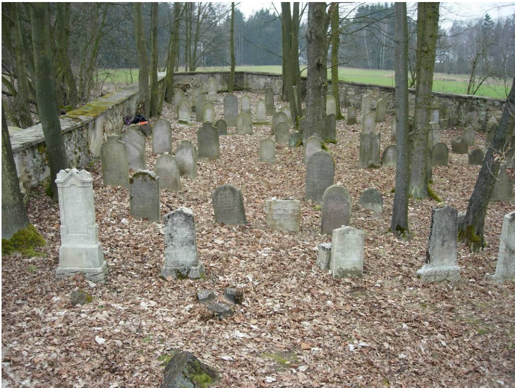
Hřbitov v Malé Šitboři v březnu 2009.